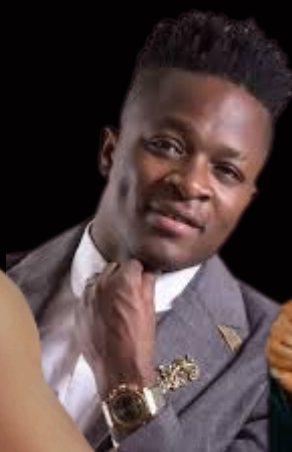
IMILO LE CHANCEUX