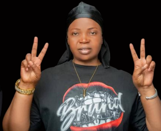
Klako KL Tchad