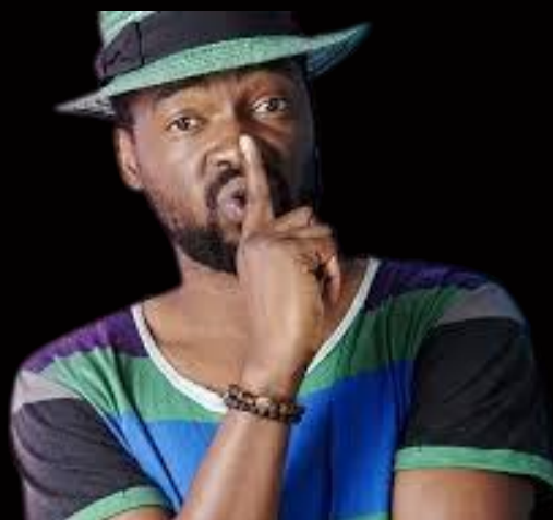
Moustik Karismatik Cameroun