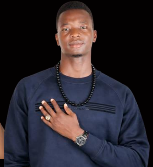
MK MAX Tchad