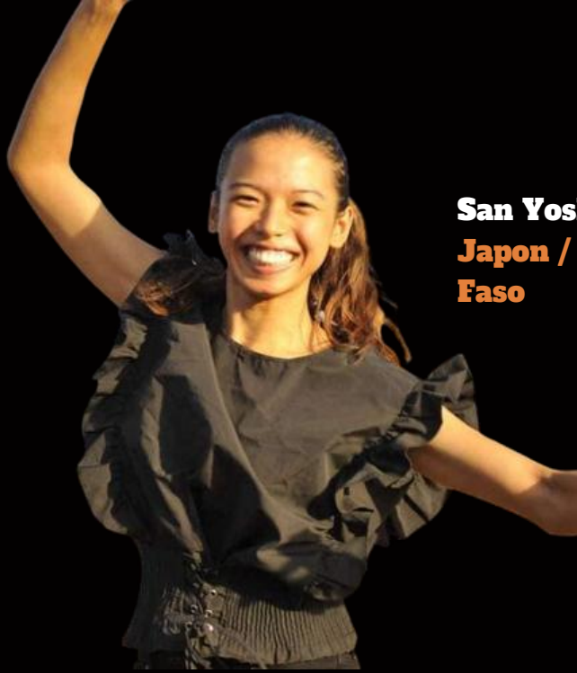
San Yoshida Japon / Burkina Faso